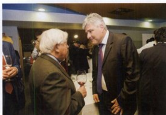
Nekdanji predsednik Milan Kučan, zatopljen v pogovor z mojim ginekologom 2014.