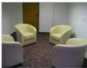
Terapevtska soba na Družinskem inštitutu Zaupanje

Za vstop v terapevtski proces je potrebno opraviti predhodni brezplačni svetovalni razgovor, na katerem terapevt ponudi prvi strokovni odziv in skupaj z uporabniki pripravi terapevtski načrt oz. svetuje glede možni rešitev aktualne stiske. Individualna, zakonska in družinska terapija je samoplačniška storitev, določeno število ur terapevtskih storitev za socialno ogrožene občane in druge prebivalce regije pa omogočajo Občina Sevnica, generalni sponzor inštituta, HESS d.o.o., ter podjetja Gen energija, Banka Koper in drugi donatorji.