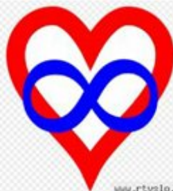
V Veliki Britaniji, na Nizozemskem, v Kanadi in nekaterih državah ZDA je registracija poliamoristov že mogoča.

” Monogamijo lahko razumemo kot strukturno utemeljeno; zakonodaja o zakonski zvezi/partnerstvih in družinsko pravo poliamorije ne predvidevajo in v tem trenutku verjetno ni države, ki bi bila pripravljena tovrstna partnerstva sprejeti oz. zakonsko urediti. Seveda pa ne moremo delati projekcij v prihodnost. Verjetno je to odvisno predvsem od tega, kakšna bo pojavnost takšnih zvez v prihodnosti.